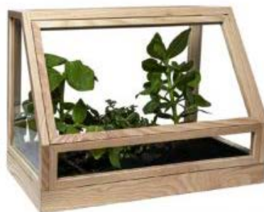
I ljust trä Mimiväxthus, Designhouse Stockholm.