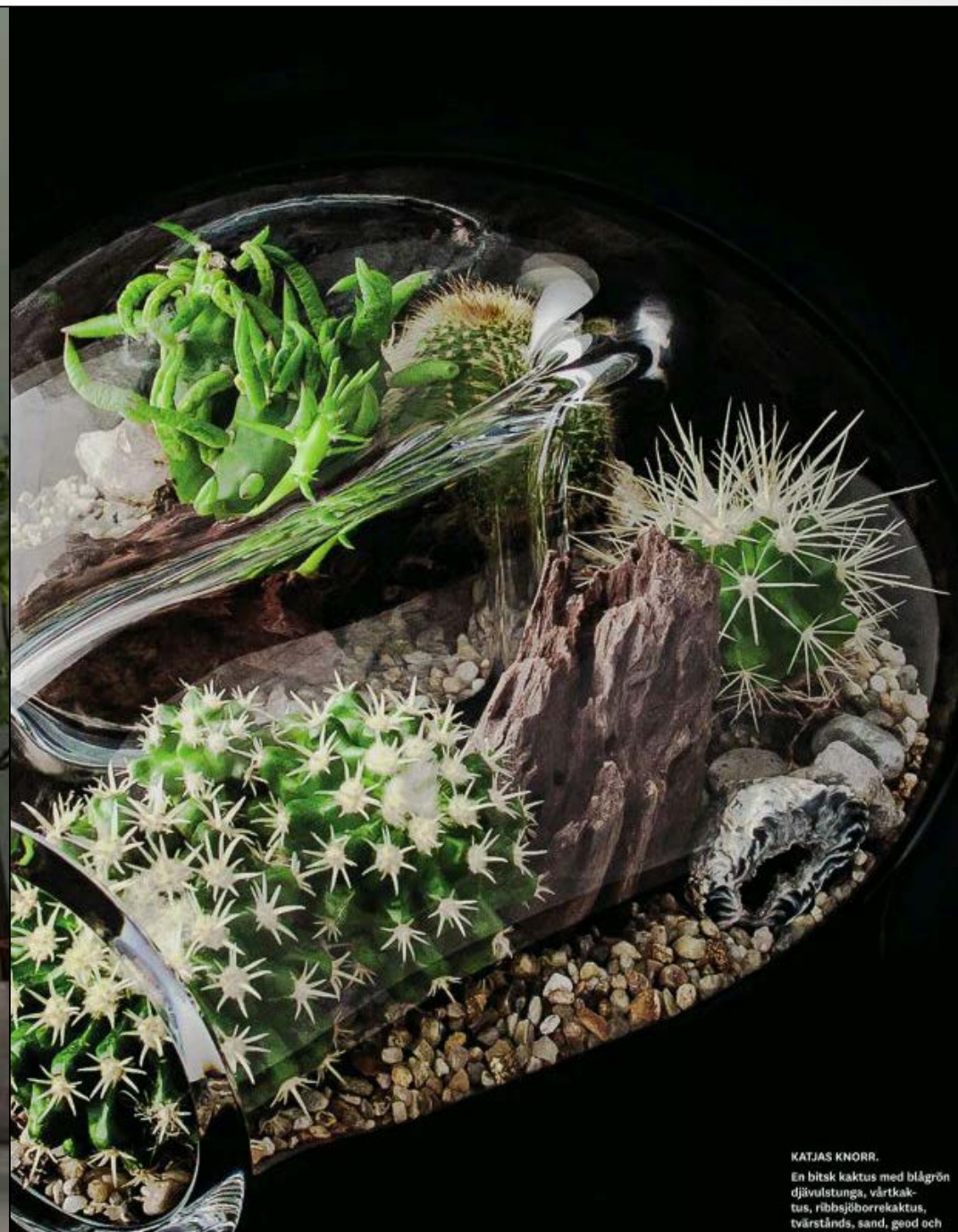
KATJAS KNORR. En bitsk kaktus med blågrön djävulstunga, värtkak- tus, ribbsjöborrekaktus, tvärstånd, sand, geod och