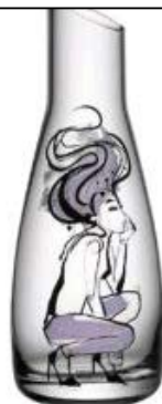
Till servering Karaff ur serien All about you, Sara Woodrow för Kosta Boda.