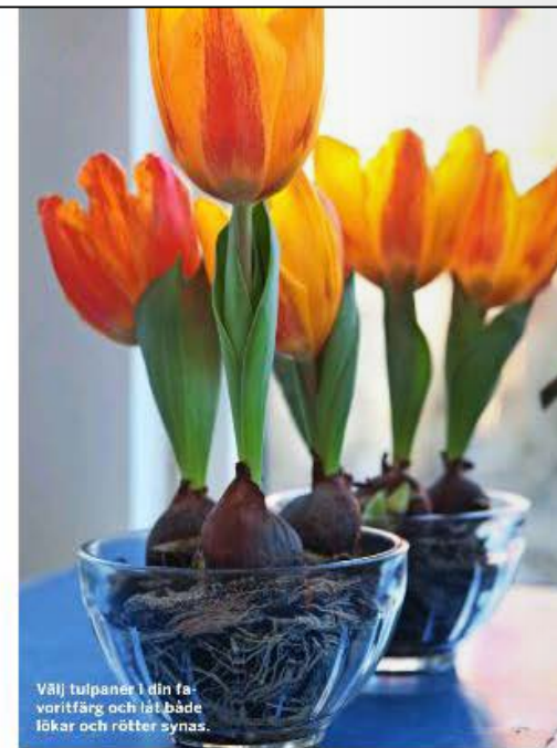
Välj tulpaner i din favoritfärg och låt både lökar och rötter synas.