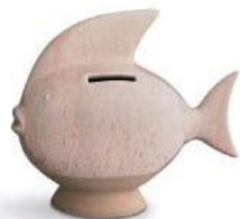
Spara i fisken Retregullig sparfisk, som är en nydesign ur arkiven, var en av årets nyheter från danska Kähler.